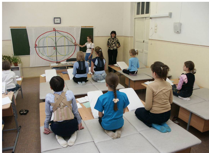
Зрительная разгрузка во время физпаузы на уроке.