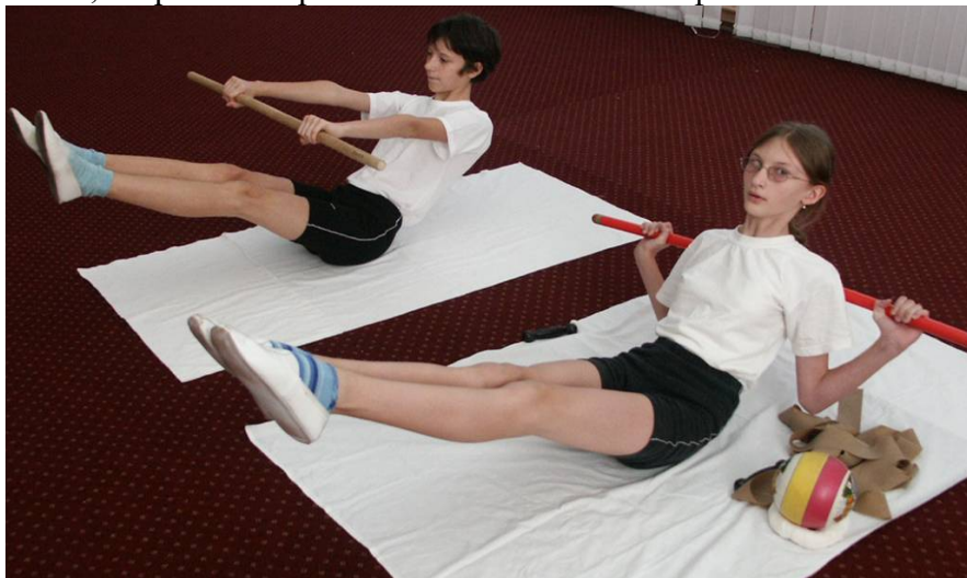
Упражнения при кифозе и плоской спине

ПРИ ПЛОСКОЙ СПИНЕ необходимо избегать упражнений, увеличивающих лордоз грудного отдела - положением головы, стараться выработать естественный кифоз.