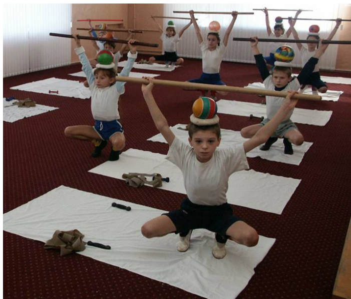
Групповое занятие АФК

В группе 10 человек. При проведении урока АФК соблюдаются общепринятые принципы и схема занятий физическим воспитанием: соблюдение кривой физиологической нагрузки, принцип рассеянности нагрузки, использование дыхательных упражнений для снятия утомления и др.